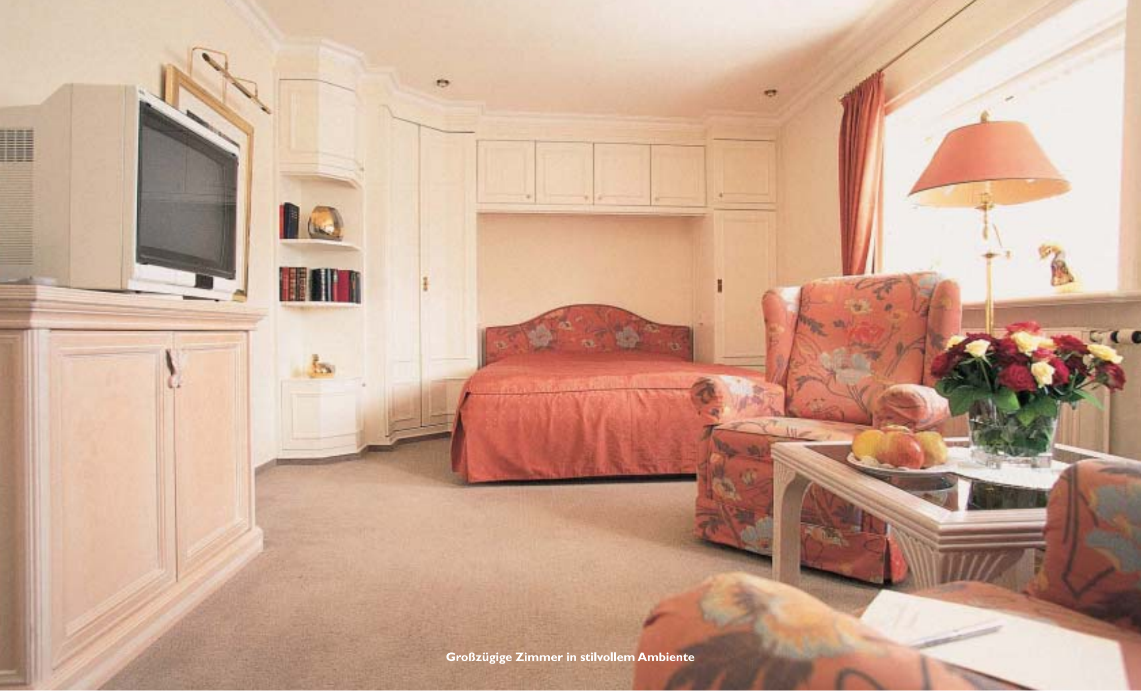
Großzügige Zimmer in stilvollem Ambiente