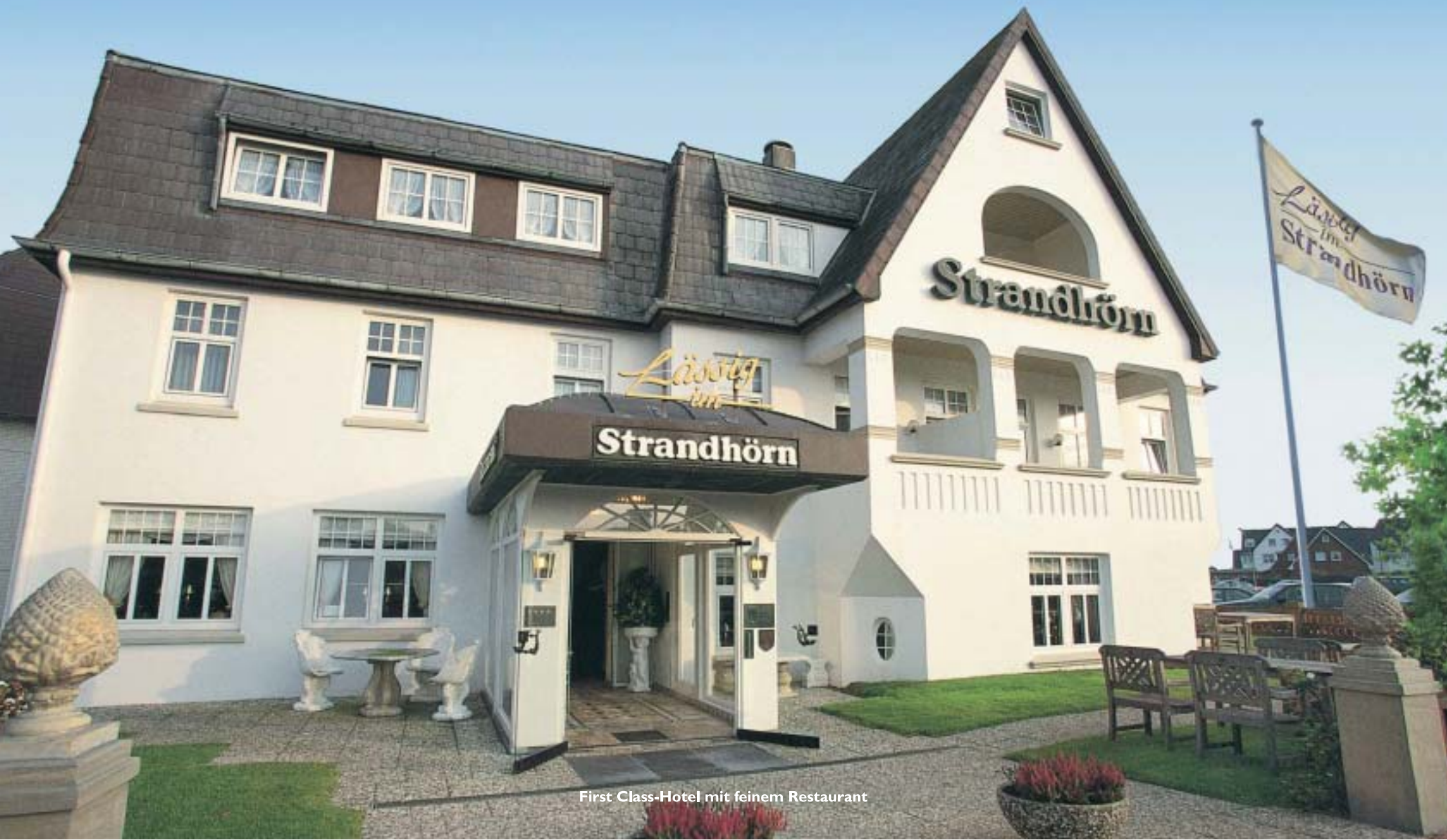
First Class-Hotel mit feinem Restaurant