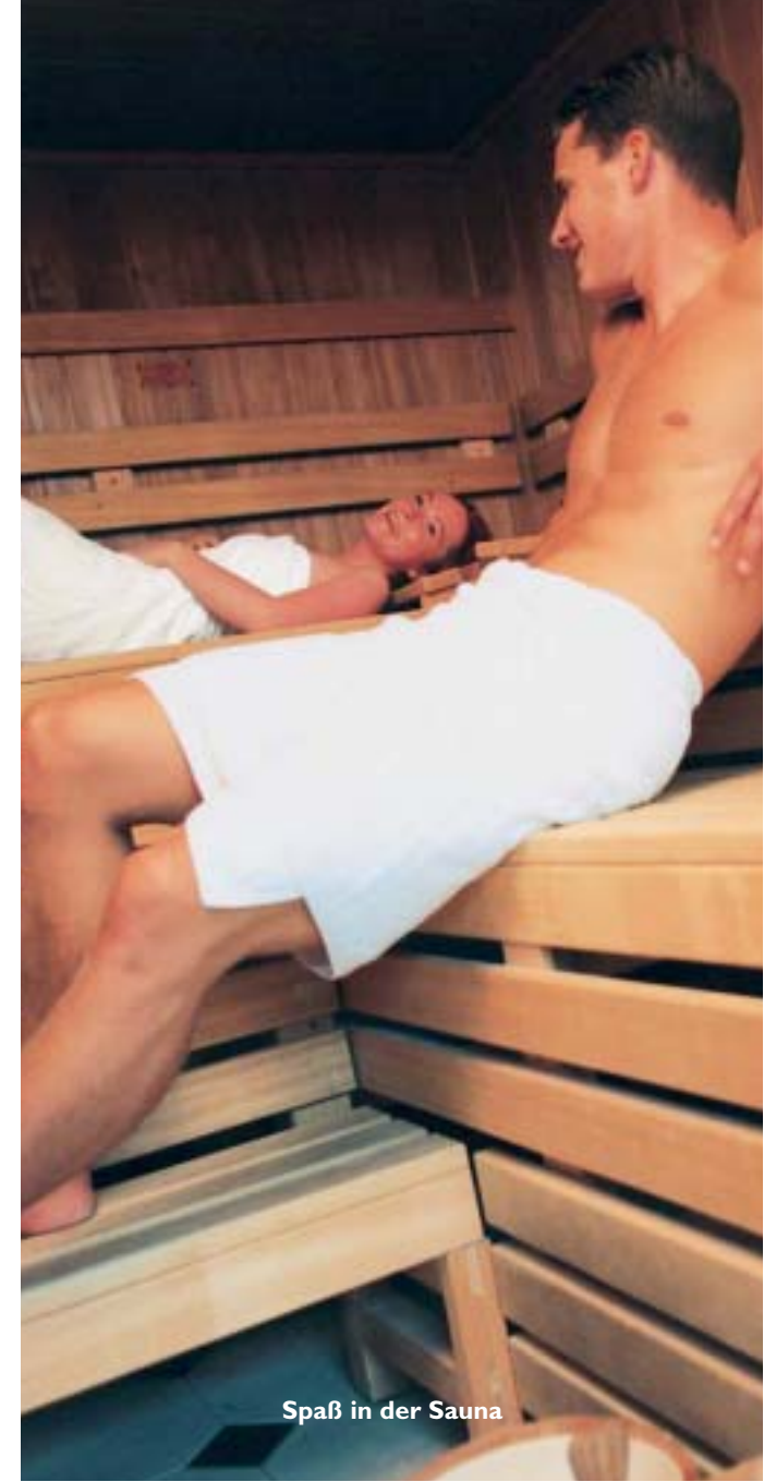
Spaß in der Sauna