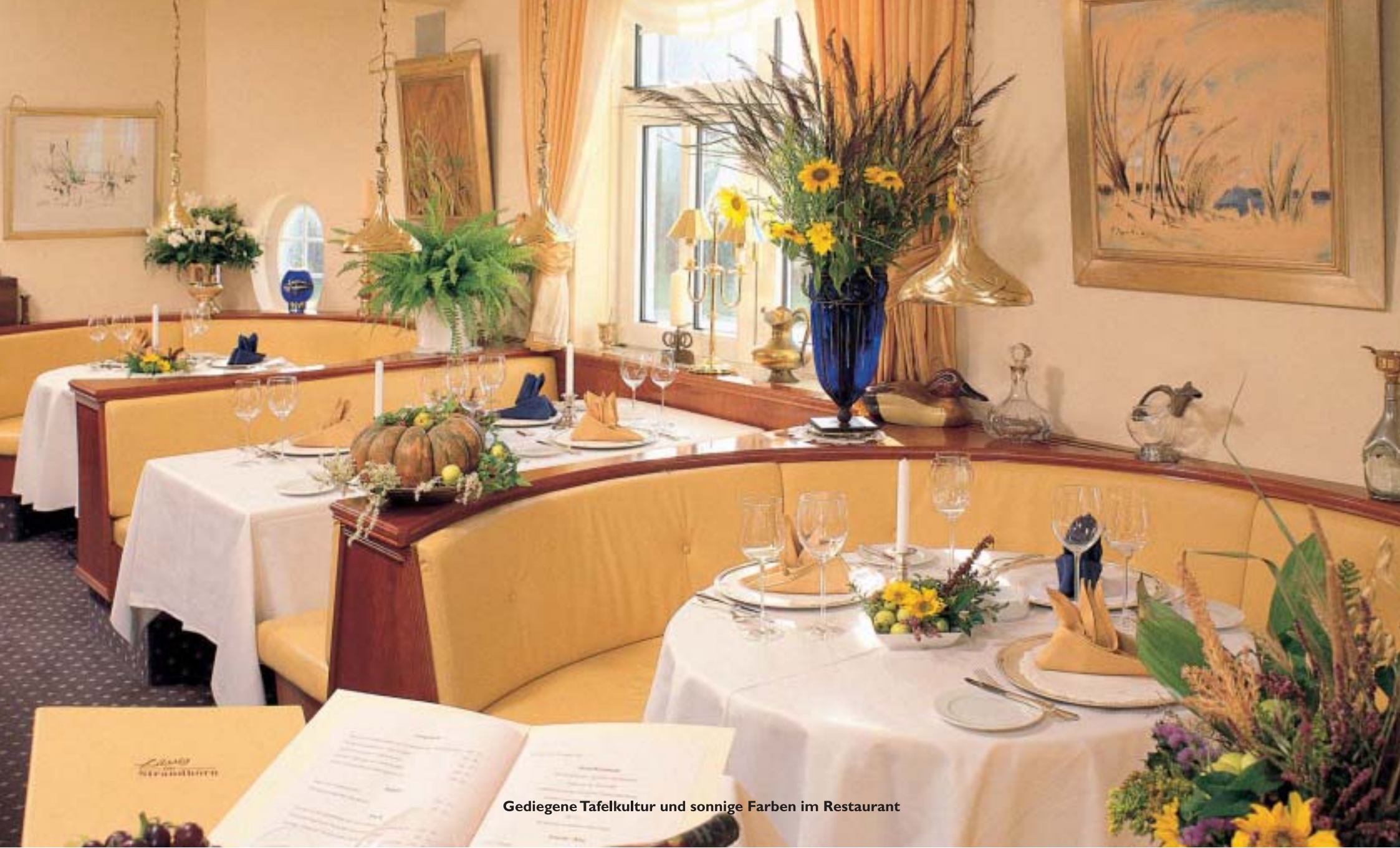
Gediegene Tafelkultur und sonnige Farben im Restaurant