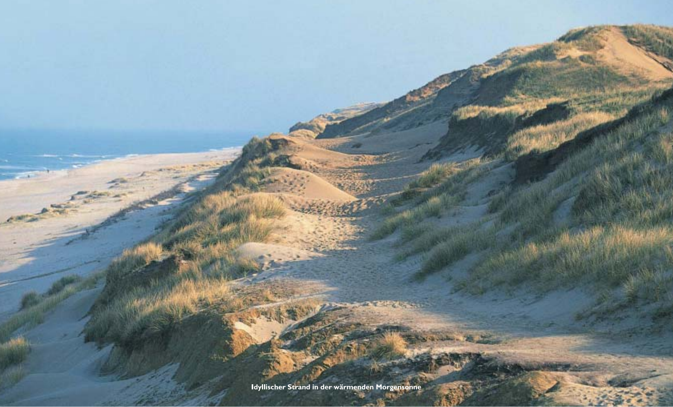
Idyllischer Strand in der wärmenden Morgensonne