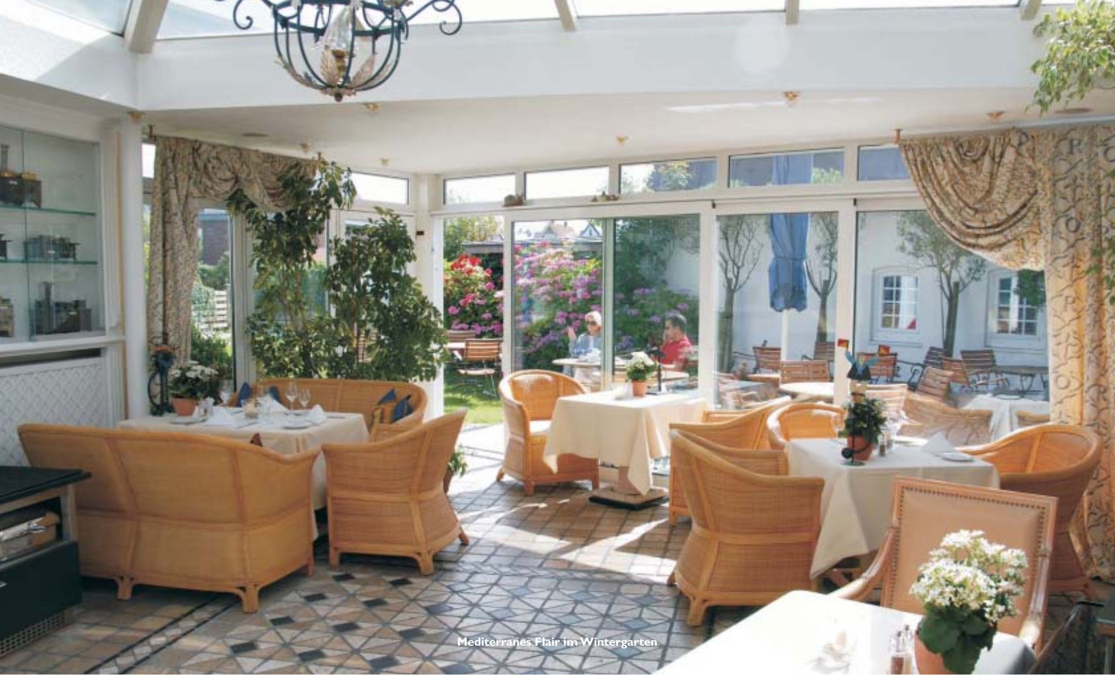
Mediterranes Flair im Wintergarten