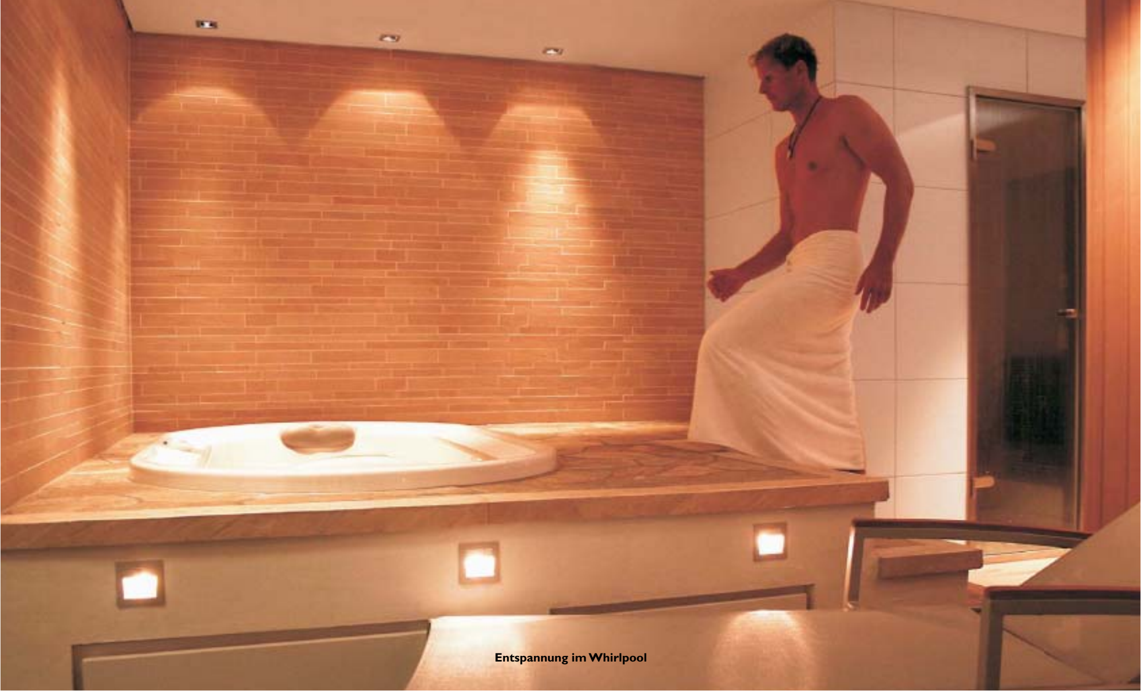
Entspannung im Whirlpool